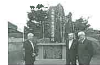
平成26年紫波町に建立された碑

旧彦部地区では、平成25年9月に、報恩会との交流を再開し、翌26年6月には、同地区公民館敷地内に「三井報恩会事業記念碑」を建立して、助成への感謝を後世に伝えることとした。旧西平内地区では、昭和16年に建立され、現在も立派に残されている「三井報恩会事業記念碑」の側に、「支援開始80周年を祝う記念碑」を新たに建てて、町を挙げての盛大な除幕式を行った。