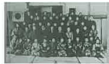
「村民の家」内にての記念写真