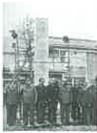
昭和16年に建立された西平内村振興記念碑の前で