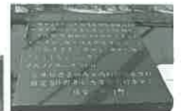
「いわれ」を刻んだいしづみ