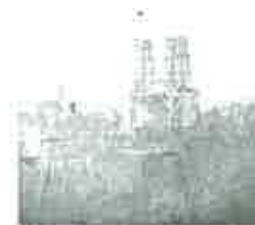
明治5年兵部省引渡当時の反射炉