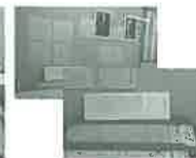
土居光華に宛てた米山の書簡

平成27年3月17日～5月6日、パート2として5月17日～7月20日まで、松阪市立歴史民俗資料館において土居光華書簡展が開催されました。土居光華（1847～1918）は兵庫県淡路の生まれ。文筆家、翻訳家など言論界で活躍。三重県の郡長を務めた後、三重県四区から衆議院議員となります。